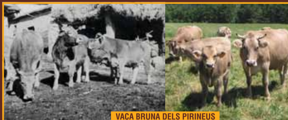
VACA BRUNA DELS PIRINEUS