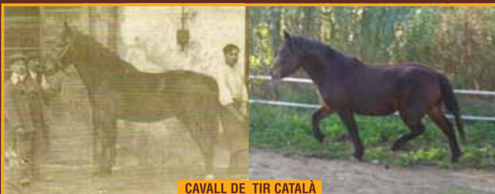
CAVALL DE TIR CATALÀ