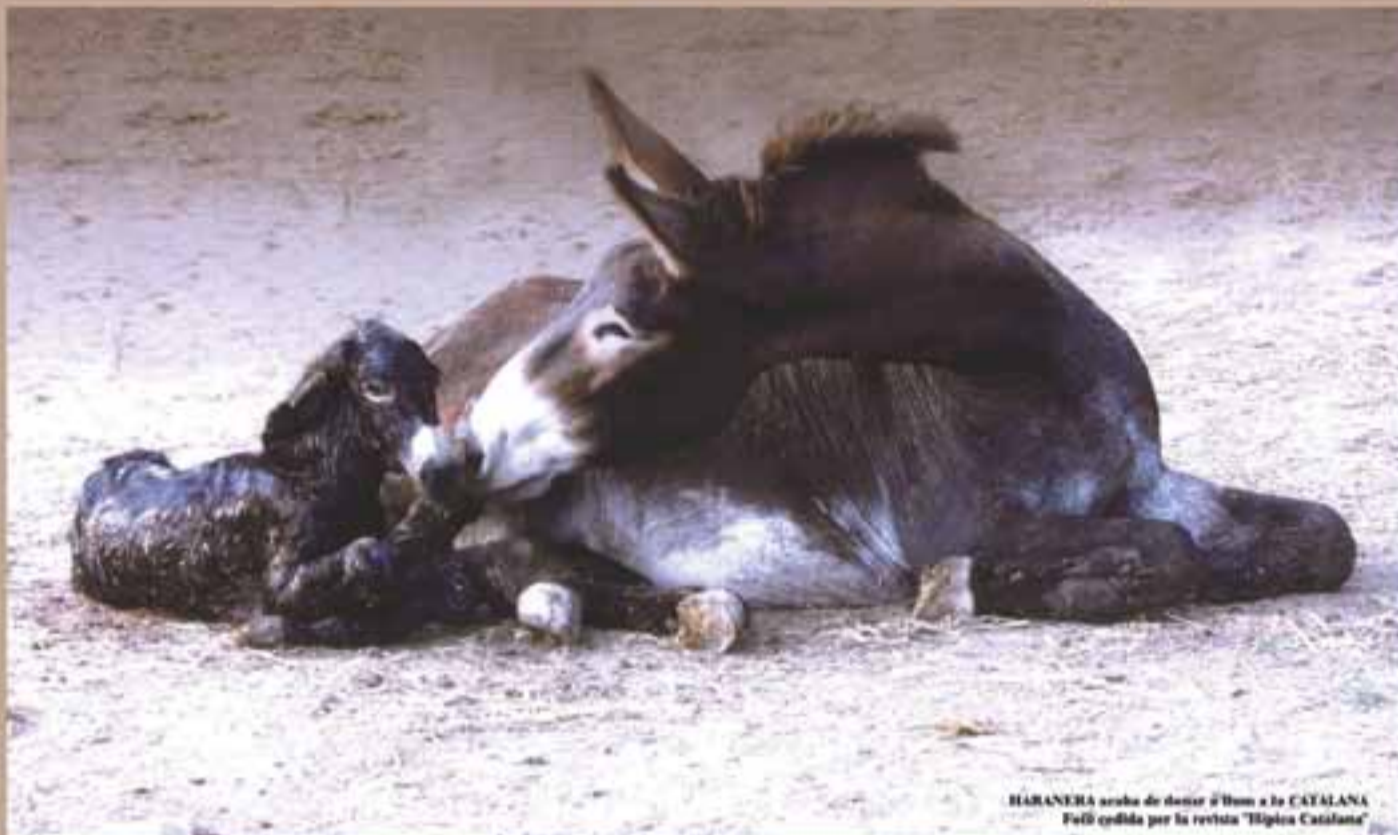
HABANERA araba de donar a l'Home a la CATALANA