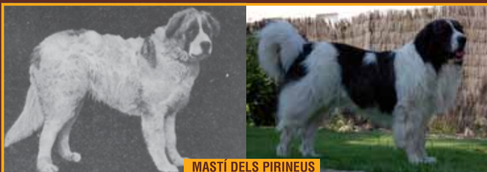
MASTÍ DELS PIRINEUS