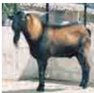
Cabra mallorquina: capa amb dibuix característic