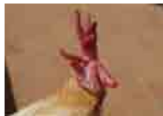
Clavell defectuós per asimetria en creu.