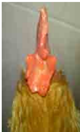
Defecte d'apèndix rodó (part central del clavell).