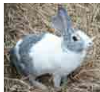
Conill pagès d'Eivissa: generalment bicolors