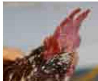
Cresta i clavell morfològicament correctes.