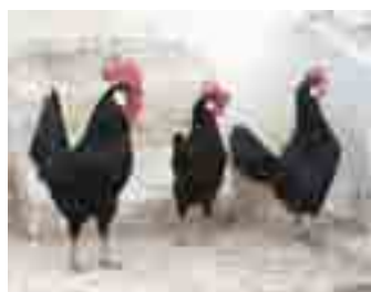
Gallina menorquina: de cara vermella i orelletes blanques

ALGUNES D'AQUESTES RACES ENS ACOMPANYARAN AQUEST ANY A LA FIRA.