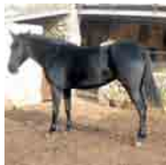
Cavall mallorquí: molt similar al cavall català