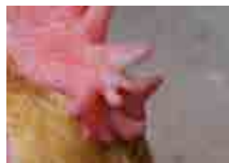
Clavell no uniforme amb rebrotos (mal dentada).