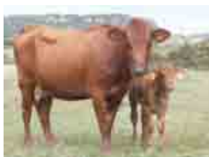
Vaca menorquina: majoritàriament sulls