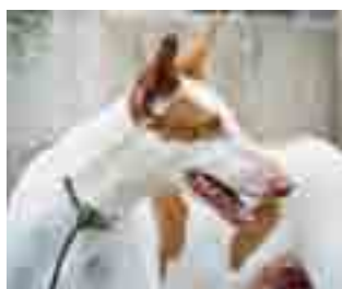
Ca eivissenc: destaca per la seva imatge faraònica