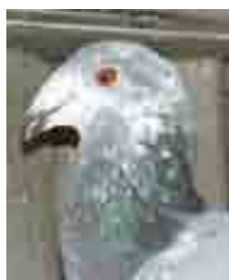
Colom nas de xot: perfil que recorda als ovis