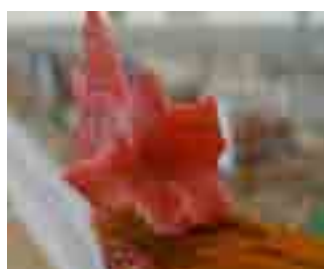
Clavells correctes: dents planes, en forma de creu i recordant una flor.