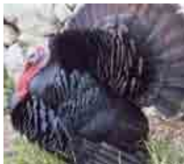
Indiot mallorquí: moc de color vermell intens