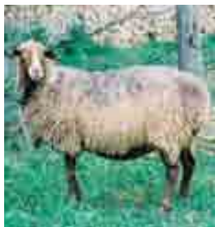
Ovella roja mallorquina: molt resistent en èpoques d'alimentació deficitària