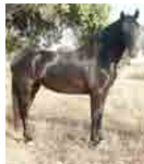
Cavall menorquí: imprescindible a les festes tradicionals